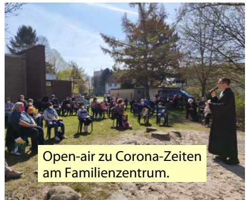
Open-air zu Corona-Zeiten am Familienzentrum.