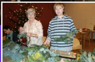
Veranstaltungen im Frieda-Frauentreff Seite 4