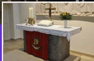
Einführung zum neuen Gottesdienstplan Seite 9