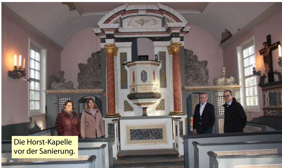
Die Horst-Kapelle vor der Sanierung.