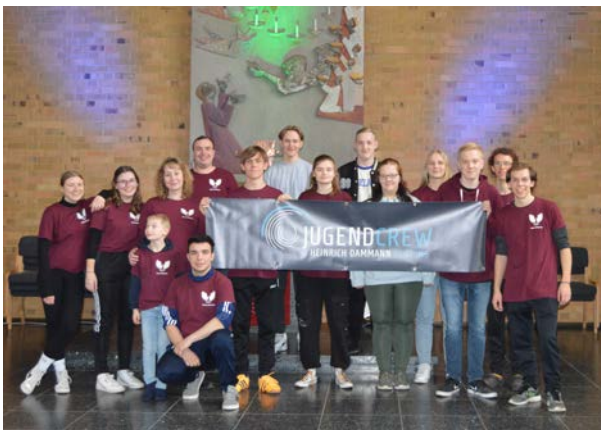
Das junge „Team Johannis“ beim Konfi-Cup 2023 im Altarraum der St.-Johannis-Kirche.