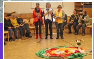
Weltgebetstag in Peine Seite 7