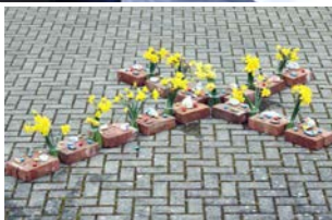
Passions- und Osterzeit Seite 3