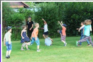
Angebote für Kinder Seite 4